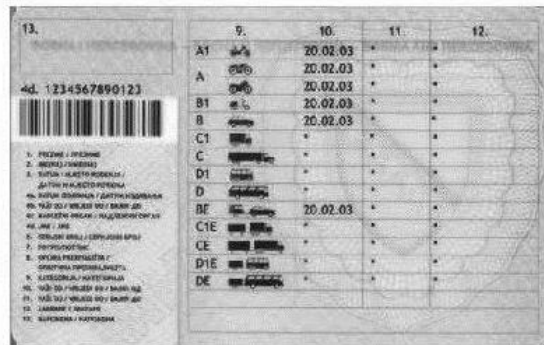
Slika 2. Zadnja strana vozačke dozvole