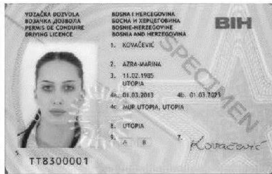
Slika 1. Prednja strana vozačke dozvole