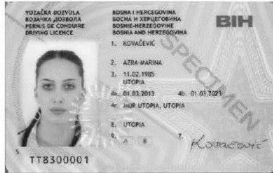
Slika 1. Prednja strana vozačke dozvole