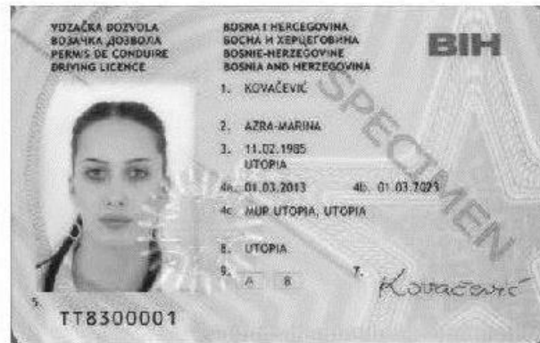
Slika 1. Prednja strana vozačke dozvole